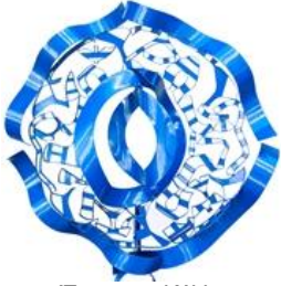
Έργο της Κέλλυ