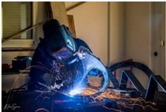
Το ατελιέ της Κέλλυ.